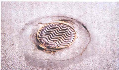
Anclaje realizado con un recubrimiento en frío.