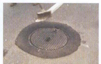
Apertura inmediata a la circulación