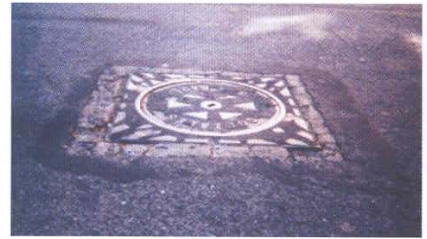
Anclaje realizado mediante un tapadera pesada.