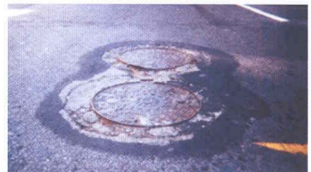
Anclaje realizado con un mortero especial rápido.