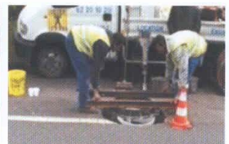
Colocación y alineación del cuadro