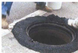
Acabado TOP ROUTE