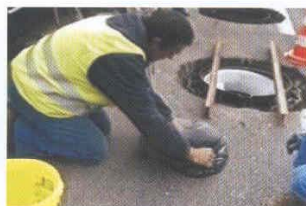
Mezcla de la parte A y B en el suelo.