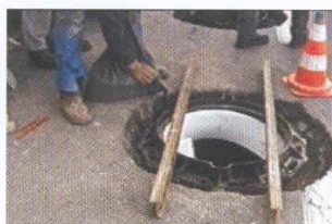
Vertido de la resina de anclaje directamente sobre el cuadro.