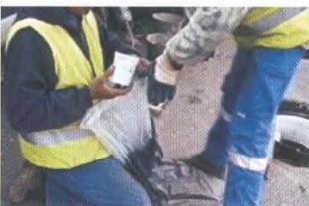
Mezcla del endurecedor B con la resina A