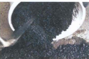
Llenado de resina FILL ROUTE