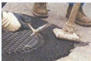
Apisonado TOP ROUTE