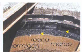
Anclaje del cuadro (sin retracción)